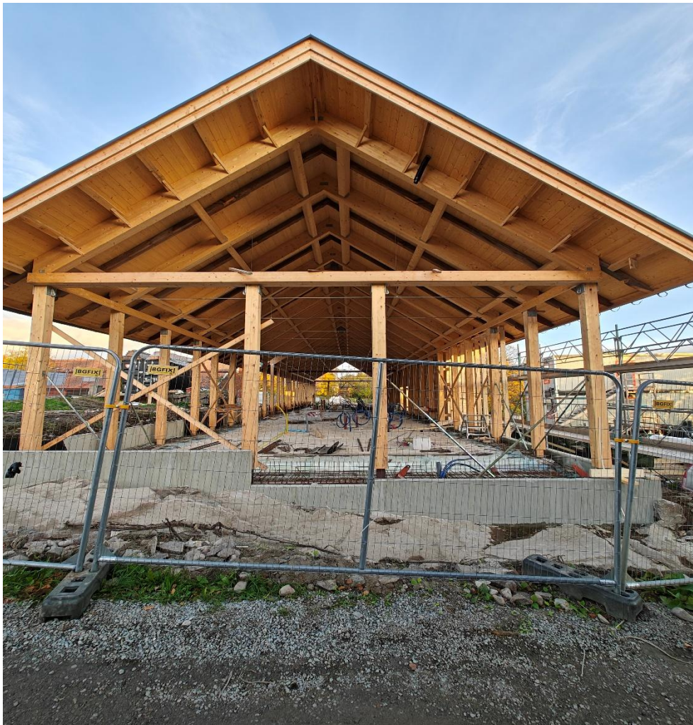
Renoverad ladugård. Kan ni hitta något i byggnaden som är original? Det kulturhistoriska värdet är borta men det blir säkert en bra utställningslokal.