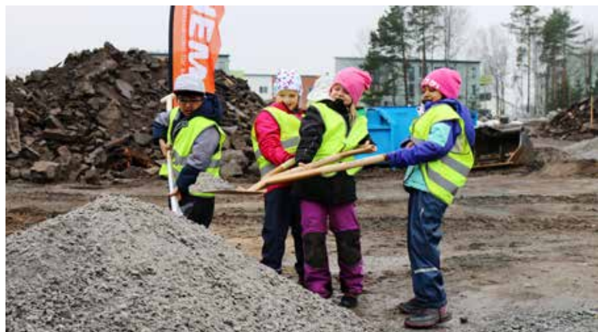
Raoul Wallenbergskolans första spadtag.

Spaden är nu satt i marken för den nya skolan i Järvastaden. Redan 2017 kommer den nya skolan stå klar, tillsammans med en förskola och en helt ny idrotts-hall. Ambitionen hos Raoul Wallenbergskolan, som ska driva skolan, är att den ska bli en naturlig mötesplats för unga och vuxna i hela området.