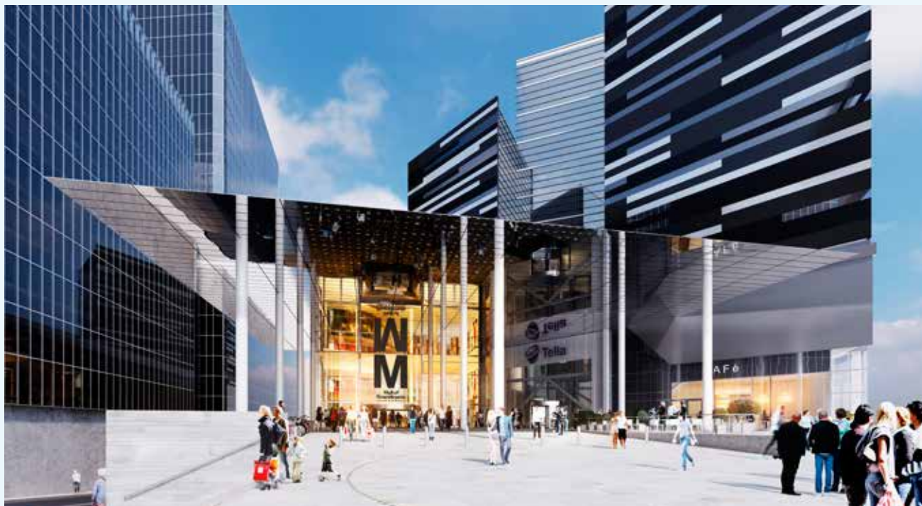
Illustration: Mall of Scandinavia

Arenastaden, där Mall of Scandinavia är beläget, har ett unikt läge. Köpcentret är enkelt att nå i och med sitt goda kommunikationsläge. Närheten till kollektiva transportmedel är god med anslutning till, bussar, pendeltåg, tunnelbana och tvärbana. I anslutning till köpcentret kommer det även att finnas cirka 4 000 nya parkeringsplatser och enkla påfarter till både E4 och Enköpingsvägen. ●