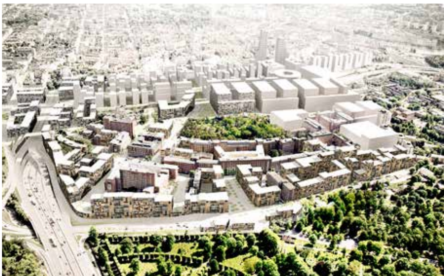
I bildens nederkant syns hur den nya stadsfronten möter Solna kyrkogård. Illustration: Urban Minds