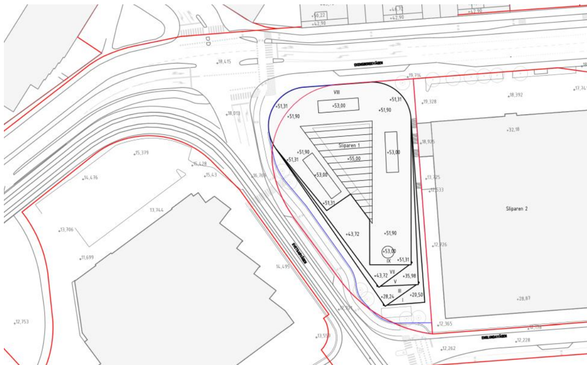
Figur 2.2. Situationsplan Sliparen 1 (april 2021).

Inom området finns planer på att uppföra en kontorsbyggnad med handel och service i bottenplan. Byggnaden planeras med upp till 8-9 våningar och en BTA på ca 20 000 – 25 000 m 2 (se figur 2.2).