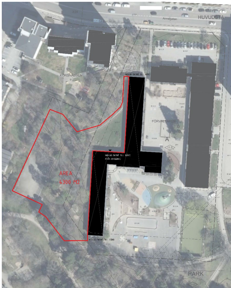
STRÄNGBACKASKOLAN UTREDNINGSSKISS NY SKOLGÅRD WI | ÄNDSKAP 2023-05-23

Skolgården bedöms i alternativet kunna utökas åt väster vilket kräver en detaljplaneändring. Området är kuperat och har stora naturvärden. I det här alternativet hamnar den utökade skolgården bakom befintlig skolbyggnad vilket gör att den blir avskärmd från övriga skolgården. Ytterligare ombyggnad av befintlig skolbyggnad skulle behöva genomföras för att möjliggöra nya entréer och passager mot den utökade gården. Kostnad för utökad skolgård bedöms till 12 mkr.