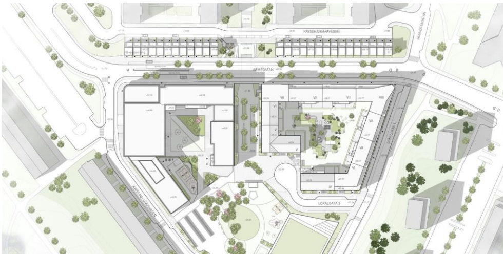
Figur 2. Samrådsförslag

I samrådet presenterades ett förslag enligt Figur 2.