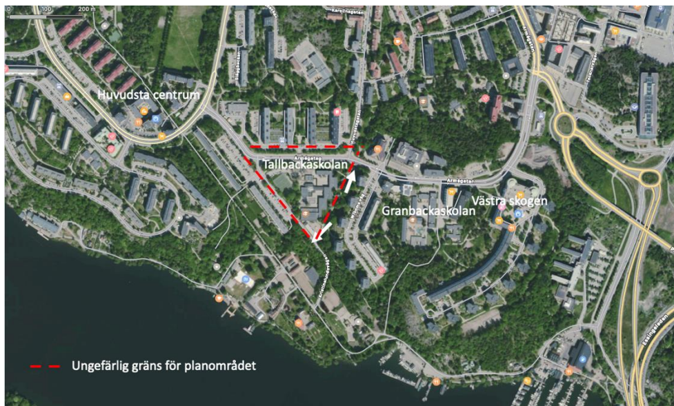
Figur 1. Tallbackaskolans lokalisering samt ungefärlig gräns för planområdet.

Solna stad har påbörjat planeringen av en ny skola, förskoleklass till årskurs 9 (F-9), för cirka 750–900 elever, i Huvudsta. Den nya skolan ska möjliggöra en kapacitet, som tillsammans med Granbackaskolan, möter den befolkningstillväxt som förväntas i Huvudsta. Den nya skolan ersätter den befintliga Tallbackaskolan. Skolan får en ny skolgård som är cirka 12 000 kvadratmeter stor. Planförslaget innebär att Tallbackaskolan rivs och ersätts med en ny skola. Den nya skolan placeras inom samma område som den befintliga Tallbackaskolan, se Figur 1. I den befintliga Tallbackaskolan går idag cirka 470 elever fördelat i årskurserna F-9.