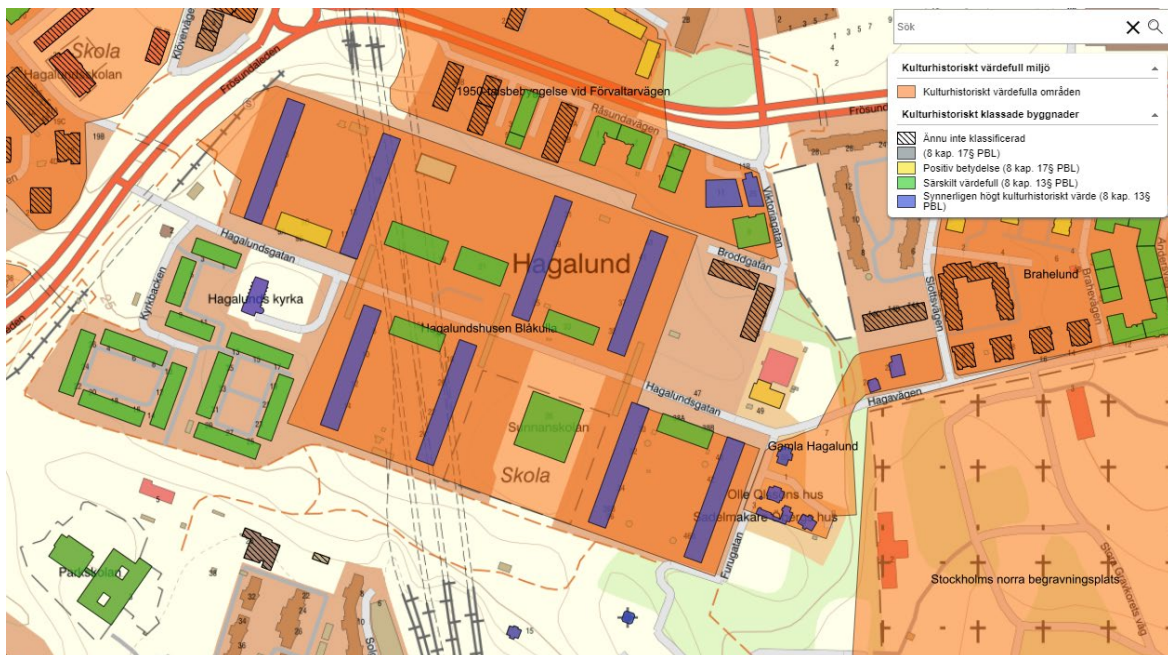
Figur 4: Bild som visar kulturhistorisk värdefull miljö och kulturhistoriskt klassade byggnader.

Hagalund och "Blåkulla" är i översiktsplanen utpekad som en sammanhängande kulturhistorisk värdefull miljö. De åtta blå husen bedöms ha det högsta kulturhistoriska värdet (blå) men även centrumbebyggelsen, skolan och fastigheterna Nordan 24 samt Sunnan 15 och 19 bedöms ha höga kulturhistoriska värden (grön). En kulturmiljöinventering behöver tas fram för att närmre beskriva områdets kulturhistoriska värde.