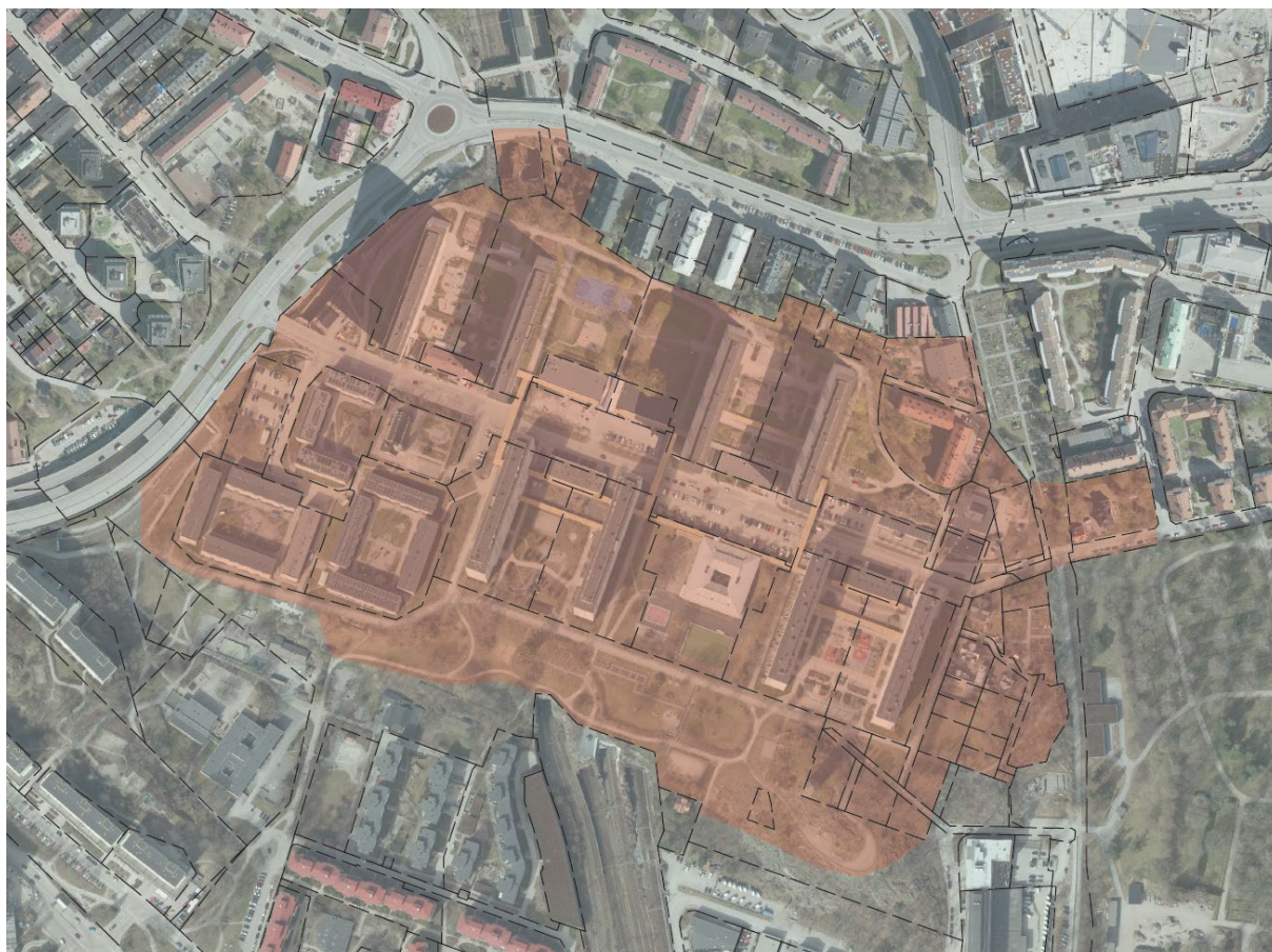
Figur 1: Bild som visar ungefärligt område med röd markering.