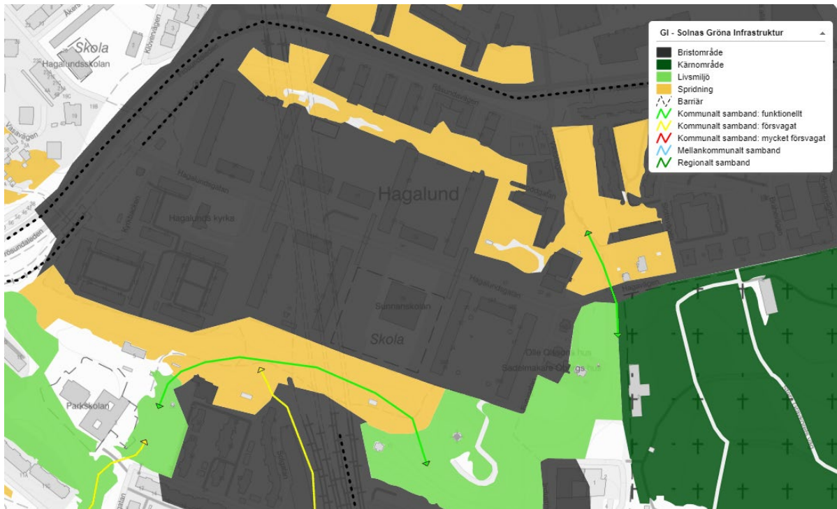
Figur 3: Bild som visar Solnas gröna infrastruktur.