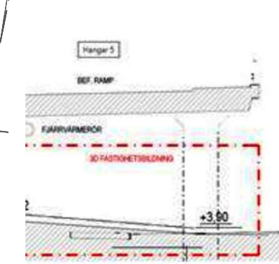
Illustration i sektion över tredimensionellt fastighetsutrymme. Tredimensionellt fastighetsutrymme för ramp tillhörandes exploateringsfastigheten markerad med röd linje. Bropelare ingår inte i det tredimensionella utrymmet.