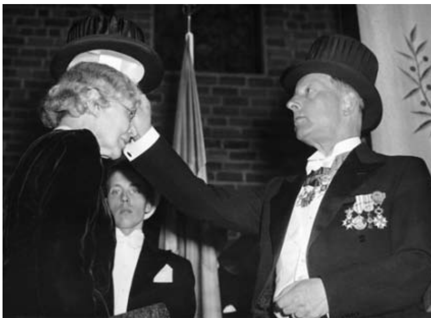
Alfbild Tamm promoveras till medicine hedersdoktor år 1951.