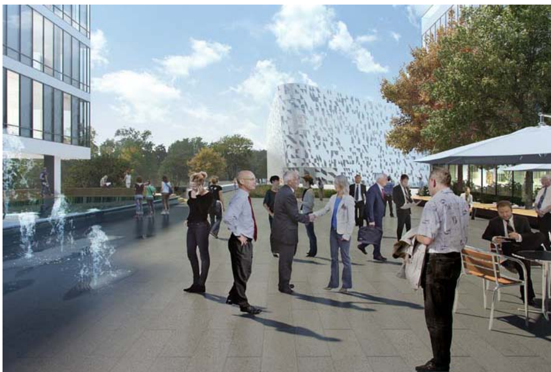
Akademiska stråket. Illustration Tengbom Arkitekter.

Akademiska stråket , Framstegsgatan och Visionsgatan är tre nya gator inom Nya Karolinska i Solna.