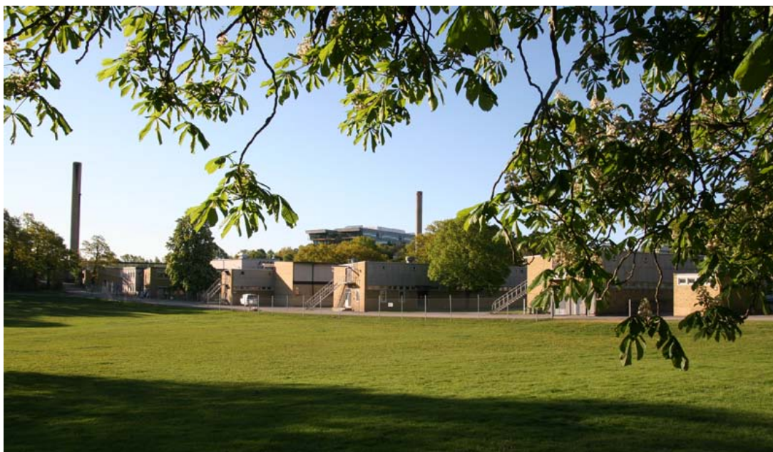
Pelousen och laboratoriebyggnader. Postens huvudkontor skymtar i bakgrunden.

Inom byggnadsminnet finns pelousen, den stora öppna gräsytan som blir områdets största offentliga rum och en tillgång för alla boende. De öppna ytorna utgjorde en viktig del i Asplunds skapande av SBL-området. Det föreslagna namnet anknyter till det ursprungliga gårdsnamnet.