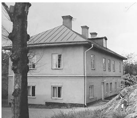
Lägenheten Ingenting som var Sergels sommarbostad.

En vårdag kom Bellman till Gustav III och begärde att få hyra en bostad till sommarnöje. Kungen, som var mycket upptagen, svarade: "Ack, käre Bellman, i år har jag ingenting att ge dig". Bellman utropade då glatt: "Får jag Ingenting till sommarnöje är jag mycket tacksam". Kungen blev något förvirrad, men förstod snart Bellmans mening och log. Och Bellman fick i alla fall sin sommarbostad i den idylliska stugan vid Ingenting.