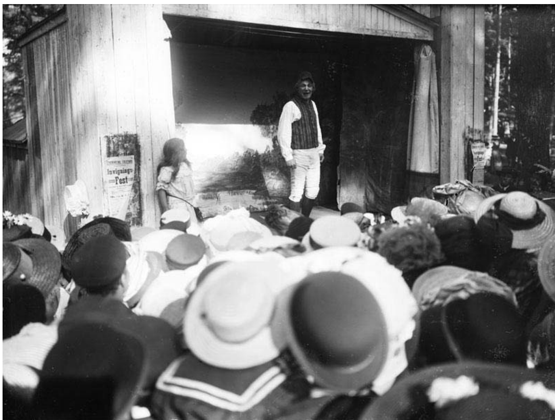
En bondkomiker uppträder i Stockholms folkpark i Ingentingskogen 1925. Bilden tillhör Stockholms stadsmuseum.