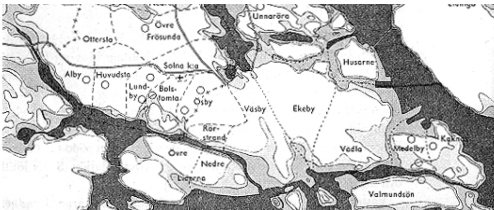
De gamla Solnabyarnas ungefärliga läge. Områden med mellangrå ton var vid vikingatidens mitt täckta av vatten.

Solna var i äldre tider ren landsbygd med bondbyar här och var. En av dem var Lundby, som låg ungefär där den nya bebyggelsen nu planeras. Lundby existerade från ca år 800 till 1630. Öster därom, någon kilometer norr om Karlbergskanalen, låg Bolstompt eller Boltofta, sedermera Bolstomta. Det senare namnet Tomteboda är en omvändning av det ursprungliga namnet. Ännu längre österut låg Ösby. På 1620-talet köpte Carl Carlsson Gyllenhielm, Gustav II:e Adolfs halvbror, byarna Bolstomta, Lundby och Ösby och slog samman dem till godset Karlberg.