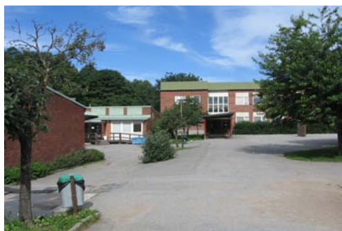
Vy söderut från f d förskoletomten, Bagartorp 18

Bostadsbebyggelsen i Bagartorp uppfördes runt 1960. Bebyggelsen, som kringgärdas av den elliptiska Bagartorpsringen omfattar fem höga punkthus, nio lägre lamellhus, ett litet handelscentrum samt en skola, ursprungligen med låg- och mellanstadium. Byggnaderna är relativt fritt grupperade och omgärdas av grönytor. Ett sammanhängande grönområde går i nord-sydlig riktning genom området. I direkt anslutning till området ligger ostkustbanan och Ulriksdals pendeltågstation.