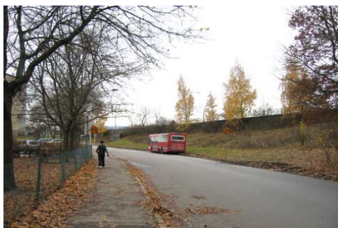
Bagartorpsringen utanför skolan. Enköpingsvägen på andra sidan slänten t.h.

Området är delvis stört av trafikbuller från såväl trafikleder (E18) som järnväg. E18 är idag den dominerande bullerkällan för området. Delar av planområdet överstiger idag 55 dB(A) ekvivalentnivå utomhus (vid fasad). Gällande statliga riktvärden saknas för skolmiljöer. Utomhus vid skolor och lekplatser rekommenderas att buller från yttre källor inte överskrider 55 dB(A) ekvivalentnivå, vilket är samma värde som skall tillämpas vid nybyggnation av bostäder. God miljö kvalitet för barn och vuxna innefattar goda ljudlandskap som ger tillfälle till goda studieförhållanden och god och hälsosäker social samvaro i skola. Skolans bebyggelse skall vid en om- eller nybyggnation utformas, utgående från platsens förutsättningar och utefter rekommenderade riktvärden, för att skapa goda ljudmiljöer. Maximal ljudnivå inomhus skall inte överstiga 45 dB(A). Placering av aktiviteter som kan uppfattas som störande för omgivningen, exempelvis bollsporter, skall beaktas i utformningen av skolan och skolgården.