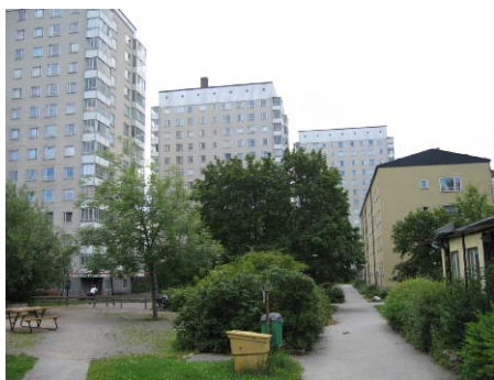
Bagartorpsskolan från söder