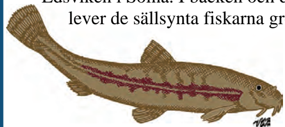
Grönling trivs i strömmande vatten.

Igelbäcken rinner från Säbysjön i Järfälla till Edsviken i Solna. I bäcken och dess utlopp lever de sällsynta fiskarna grönling och nissöga.