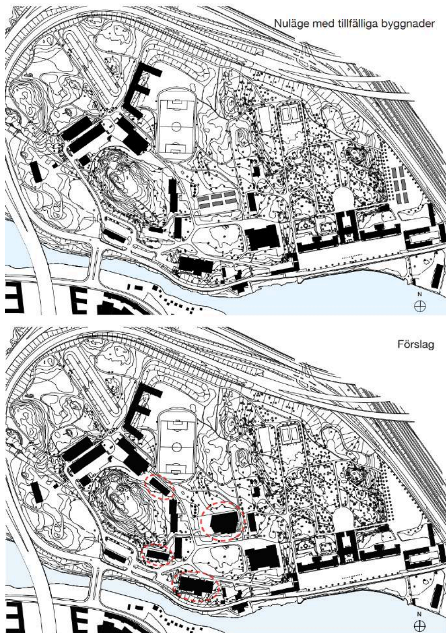
Figur 4. Föreslagen ny bebyggelse (inringat i rött) i Karlberg. Byggnaden i söder är befintlig men kommer att byggas om. Den planerade östra byggnaden ersätter baracker som står på platsen idag. Övriga svarta siluetter är befintliga byggnader.