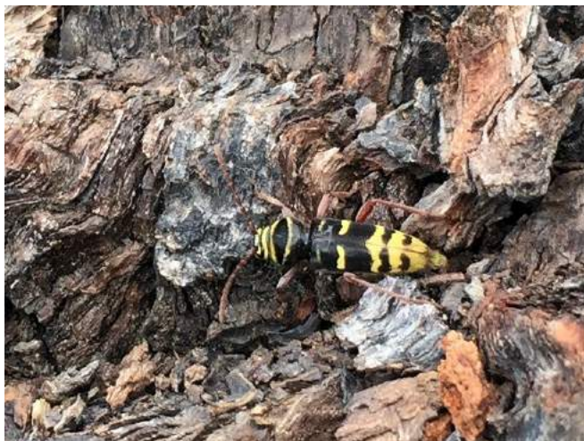
Figur 1. En hona av bredbandad ekbarkbock Plagionotus detritus springande på en ekstam.

Under 2020 fick Calluna AB i uppdrag av Klark.Zenit arkitekter att göra en bedömning kring hur den planerade bebyggelsen kan tänkas påverka livsmiljöer och spridningsstråk inom Karlbergsområdet för eklevande insekter i allmänhet och bredbandad ekbarkbock i synnerhet.