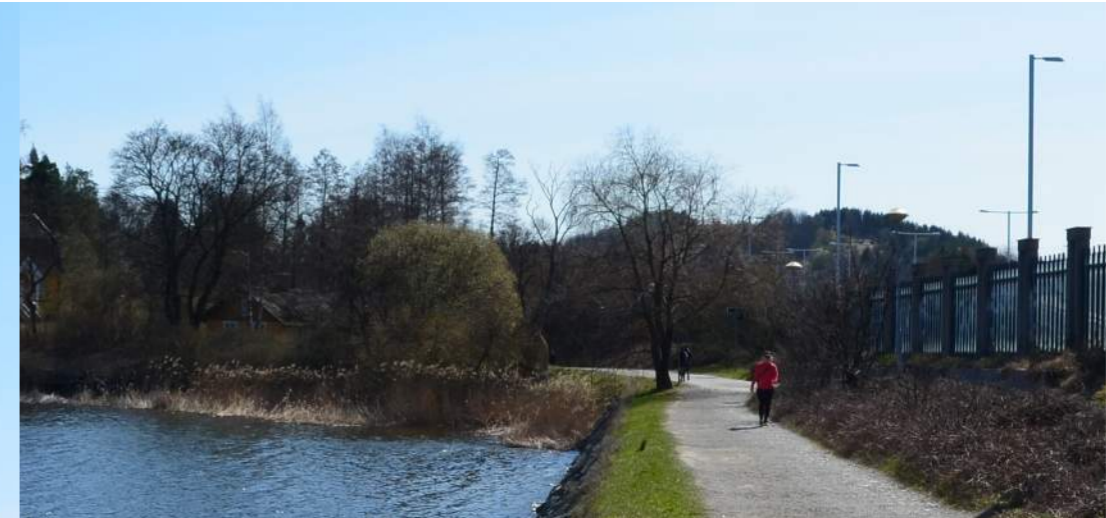
Inzoomad vy utan bebyggelse

Kommentar: I vyn från cykelvägen längs E4 norr om detaljplaneområdet, kommer den föreslagna byggnaden att uppfattas. I förhållande till Linnéaholm är den föreslagna byggnaden acceptabel i skala och dominerar inte över den befintliga bebyggelsen. Den föreslagna byggnaden underkastar sig även närområdets geografiska storformer i skala, i form av Stockholmsåsen.