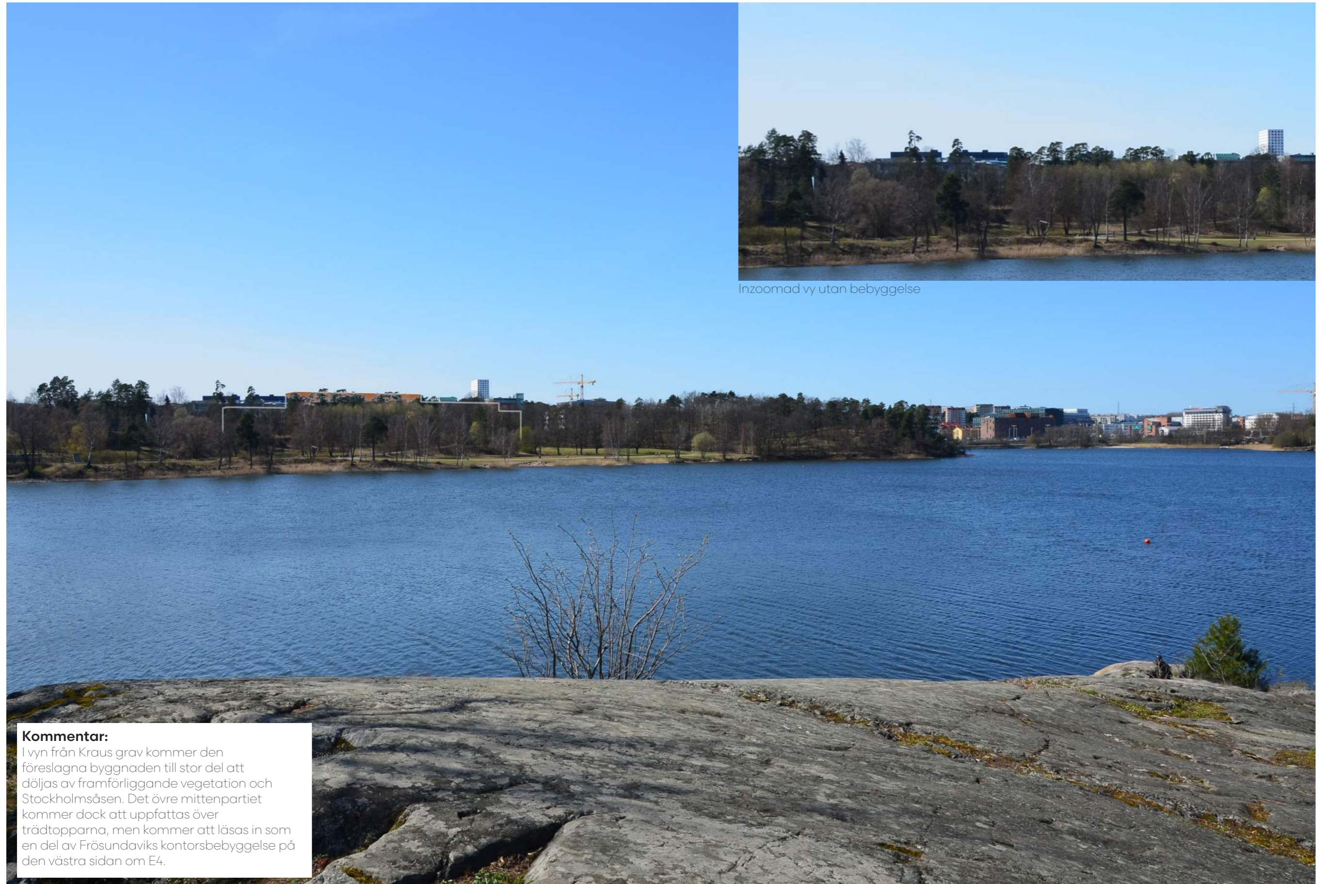
Inzoomad vy utan bebyggelse