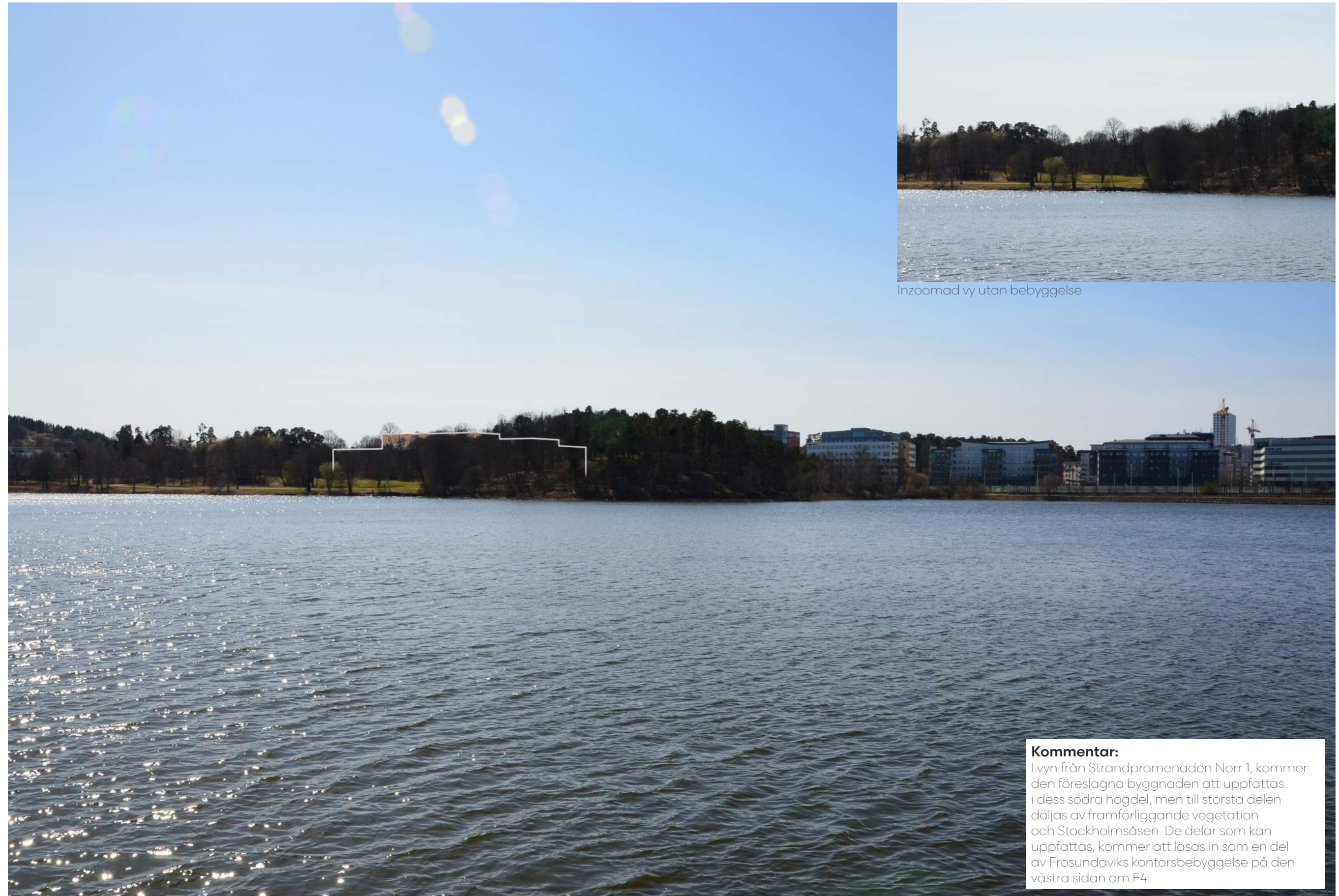
Inzoomad vy utan bebyggelse

Kommentar: I vyn från Strandpromenaden Norr 1, kommer den föreslagna byggnaden att uppfattas i dess södra högdal, men till största delen döljas av framförliggande vegetation och Stockholmsåsen. De delar som kan uppfattas, kommer att läsas in som en del av Frösundaviks kontorsbebyggelse på den västra sidan om E4.