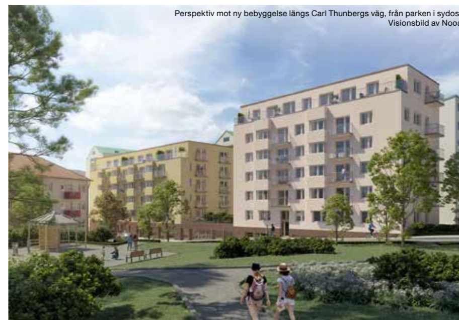
Perspektiv mot ny bebyggelse längs Carl Thunbergs väg, från parken i sydost. Visionsbild av Nooa.