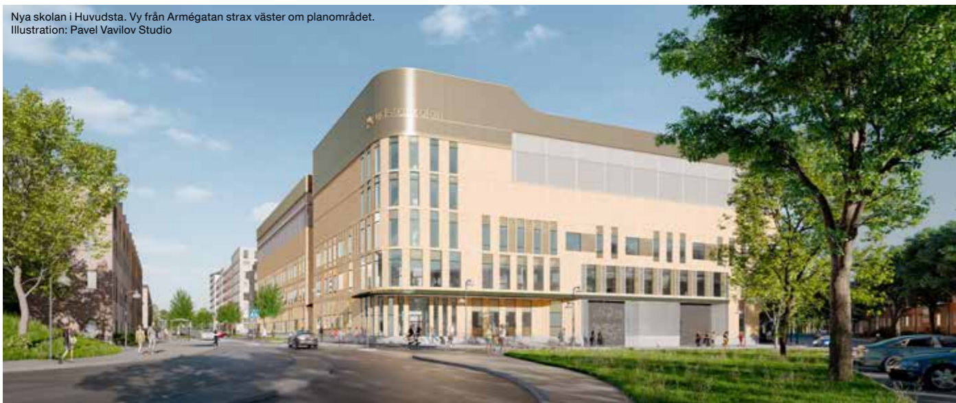
Nya skolan i Huvudsta. Vy från Armégatan strax väster om planområdet. Illustration: Pavel Vavilov Studio