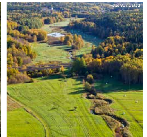
Flygfoto över Igelbäcken.