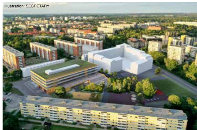
Översikt från sydväst.