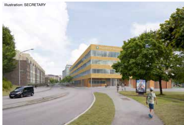
Vy österut längs Armégatan.