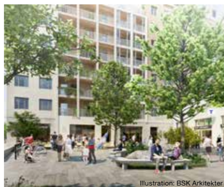
Illustration: BSK Arkitekter

Rumeysa, Max och Mogos ordnar kvällsfofboll, en del av initiativet Helghäng i Hagalund.