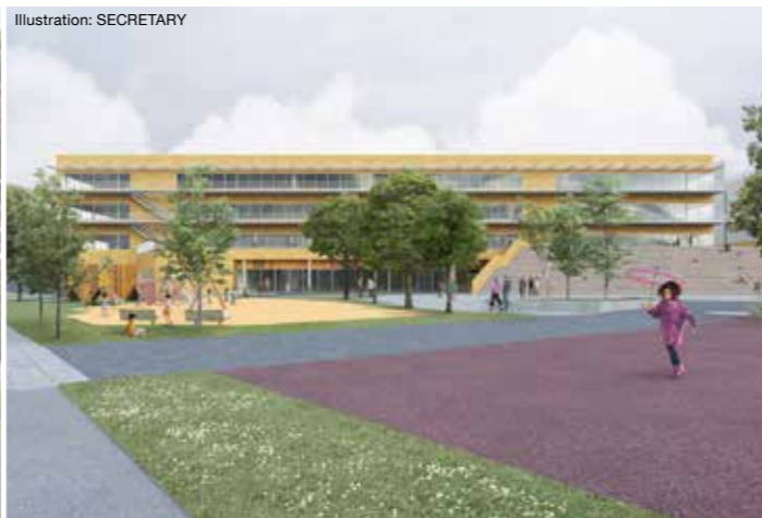
Vy norrut mot skolgården och den utvändiga trappan.