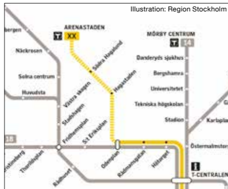
Illustration: Region Stockholm

Utvecklingen av Överjärva gård som besöksmål och kulturmiljö fortsatte.