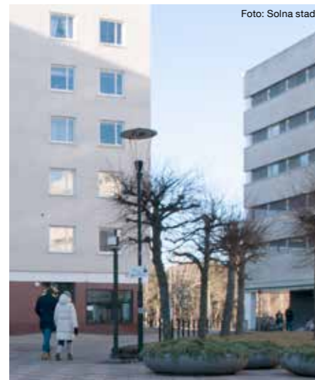
Torget i Västra skogen.

Det kommer också göras en satsning på belysning av torget i Västra skogen. Ett nytt belysningsprogram kommer att genomföras som ska skapa trivsel och inbjuda till mer liv och rörelse. Platser runt torget som upplevs som mörka kommer även att åtgärdas med trivselskapande belysning, liksom gång- och cykelvägen mot Pampasparken.