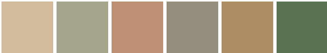
Exempel på fasadkulörer från olika delar av Solna.