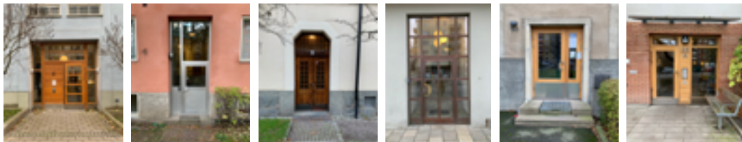
Exempel på entréer från olika delar av Solna.