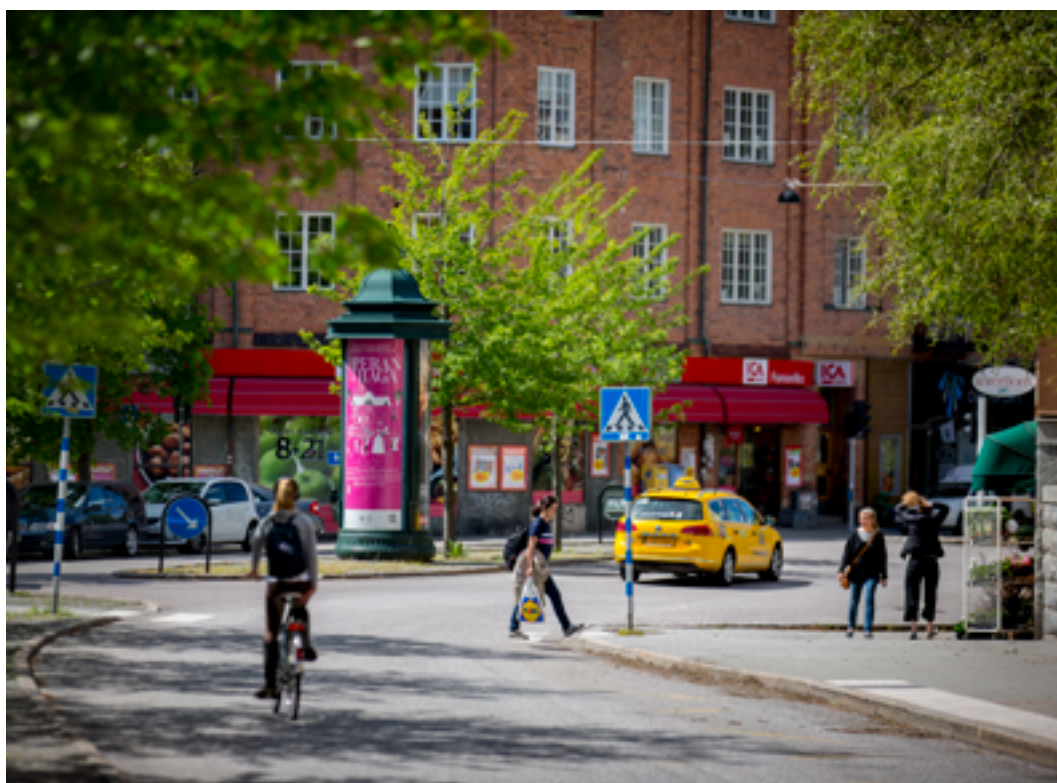
Råsundavägen vid Stråket.

Uppdatering och revidering av arkitekturprogrammet sker parallellt med att översiktsplanen aktualitetsförklaras eller alternativt uppdateras.