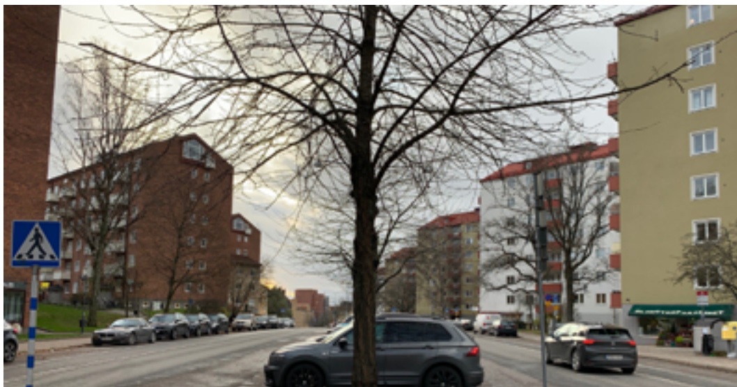
Råsundavägen från Nackrossparken till Bokvägen.