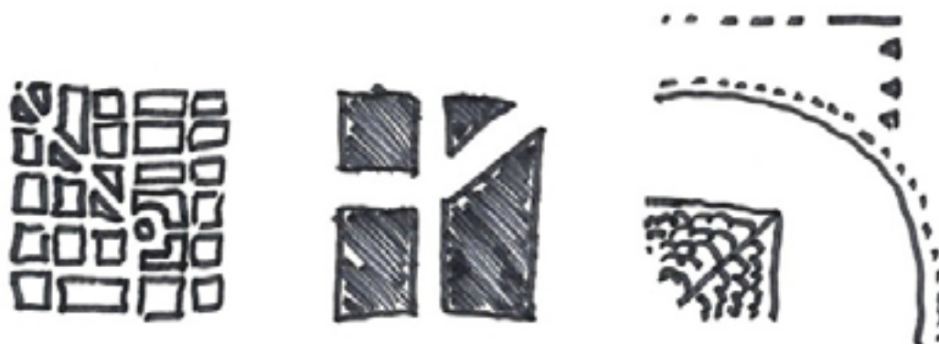
Staden i tre skalor ovanifrån: stadsmönstret, kvarteret och gatuhörnet.

Den tredelade skalan visar också staden i olika dimensioner: från marken i ögonhöjd, i mellanskala och ovanifrån. När vi zoomar mellan dessa nivåer får vi en bättre förståelse för hur staden och dess delar förhåller sig till varandra.