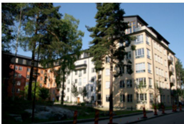
Modern kvartersbebyggelse i Järvastaden.

Stadsbyggnadskaraktären i del fyra omfattar förutom Råsunda också Filmstaden, Frösunda och Järvastaden.