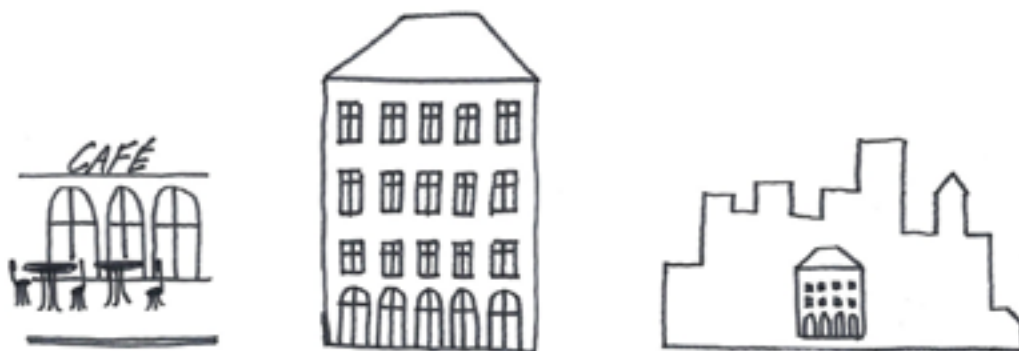
Bebyggd miljö i tre skalor: ögonhöjden, byggnaden och staden som helhet.

Solnas arkitektoniska principer baseras på ett sätt att se på den omgivande stadsmiljön genom tre skalor: människoskalan , bebyggelseskalan och stadsskalan . I programmet kallas dessa för ögonhöjden, byggnaden och stadens som helhet. Även om staden i sig är mycket mer komplex ger detta ett sätt att gemensamt kunna bedöma stadens delar som detalj, som rum och som helhet i samma stund.