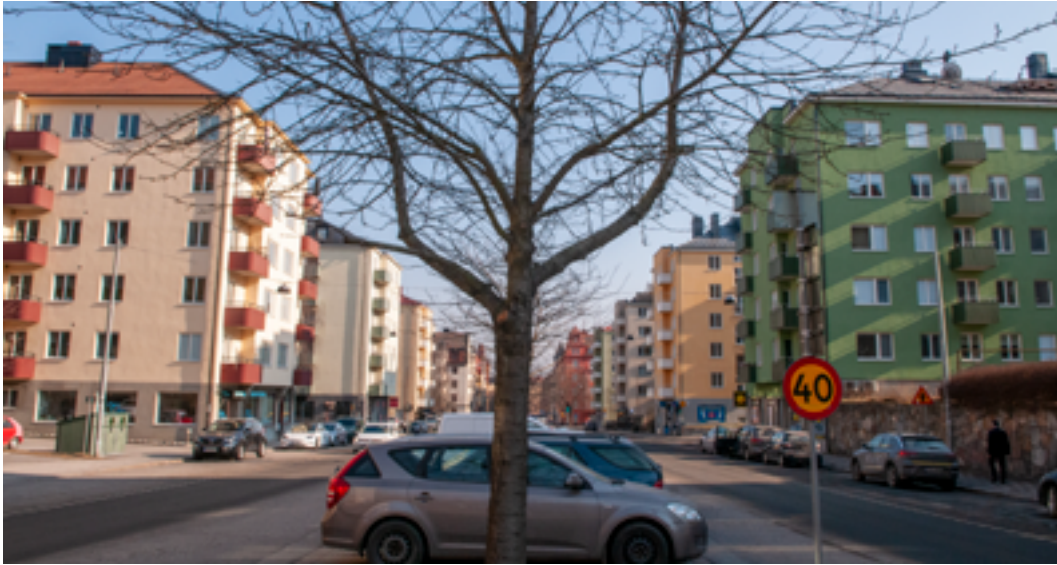
Råsundavägen från Förrådsgatan till Näckrosparken.