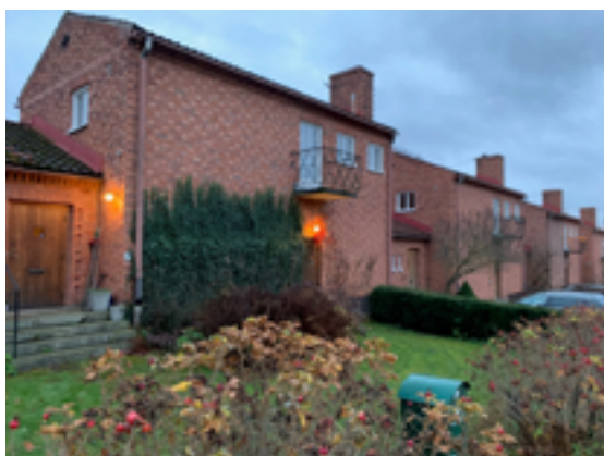
Exempel på småhusbebyggelse, kedjehus från Solna kyrkby.

Stadsbyggnadskaraktern i del ett är tillkommen under 1874-års byggnadsstadga och omfattar förutom Råsunda också Vasalund, Råstahem Solna kyrkby och Stocksundstorp.