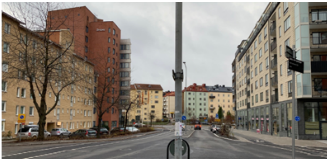
Råsundavägen från Näckrosparken till Bokvägen.