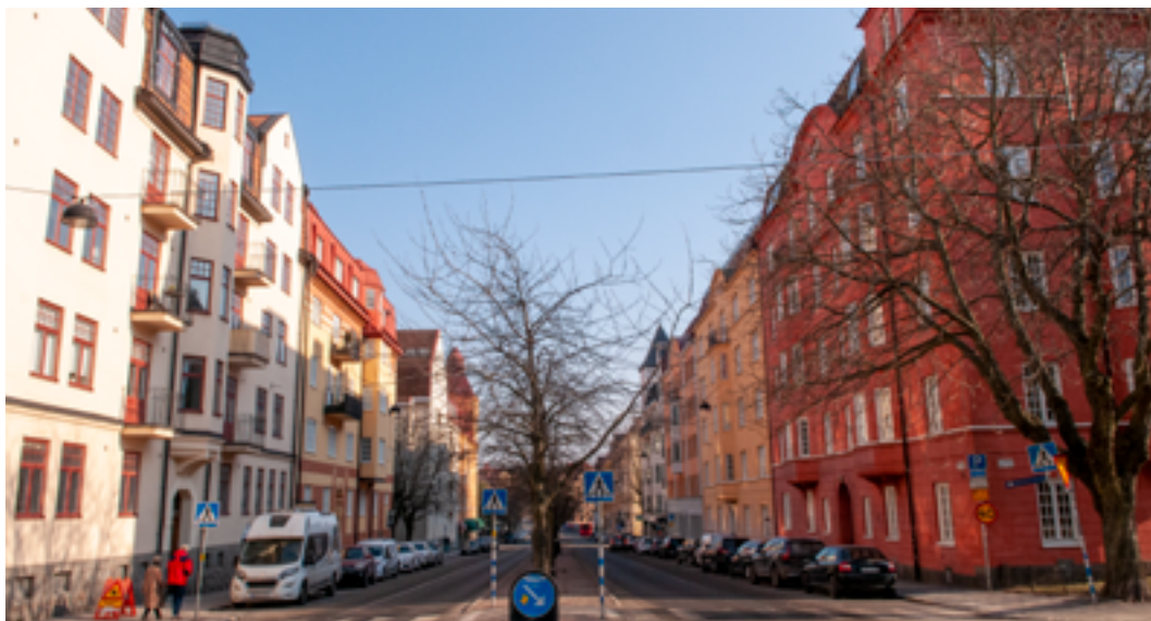
Råsundavägen mellan Stråket och Förrådsgatan.