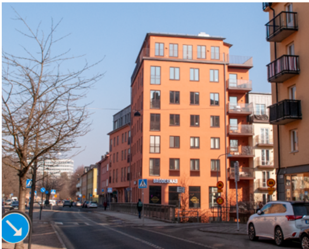
Exempel på förtätningsprojekt vid Råsundavägen.

Stora delar av Solnas bostads- och arbetsplatsområden är uppförda under perioden 1940-1990-talen. Därefter har utbyggnaden av helt nya och moderna bebyggelseområden pågått. I Solna finns därför idag ett stort spektrum av arkitektoniska formspråk och i de olika stadsdelarna uppvisas vitt skilda stilideal och karaktärer.