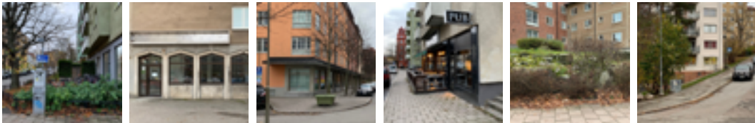
Exempel på hur bottenvåningar från olika delar av Solna möter marken.