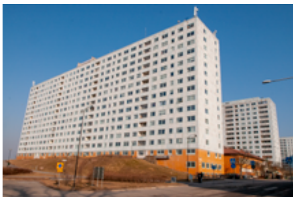
Exempel på lamellhusbebyggelse i skivhusform från Hagalund.

Stadsbyggnadskaraktären i del tre omfattar förutom Råsunda också Bagartorp, Bergshamra, Hagalund, Huvudsta och Skytteholm.