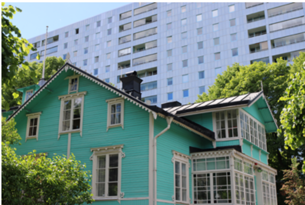
Hagalund med Olle Olsson-museet och blåkullahusen i bakgrunden.

Genom att förstå vad som styr gestaltningen av dagens Solna och vilka arkitektoniska val som kan göras för att uppnå ett gott resultat för framtiden, bygger vi en estetiskt tilltalande likväl som sammanhållen och levande stad som växer och utvecklas hållbart för alla Solnabor.