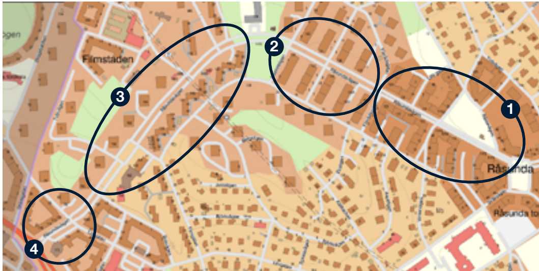
Råsundavägen med fyra distinkt olika stadsbyggnadskaraktärer. Grundkarta från Lantmäteriet.

Längs Råsundavägen finns goda representanter för de planideologier och arkitekturideal som från sekelskiftet 1900 fram till idag har präglat Solnas bebyggelse. Tydliga exempel på i stort alla bebyggelsetyper i staden går att hitta ut med Råsundavägen och sträckan kan därför utgöra en provkarta över hela stadens bebyggelse.