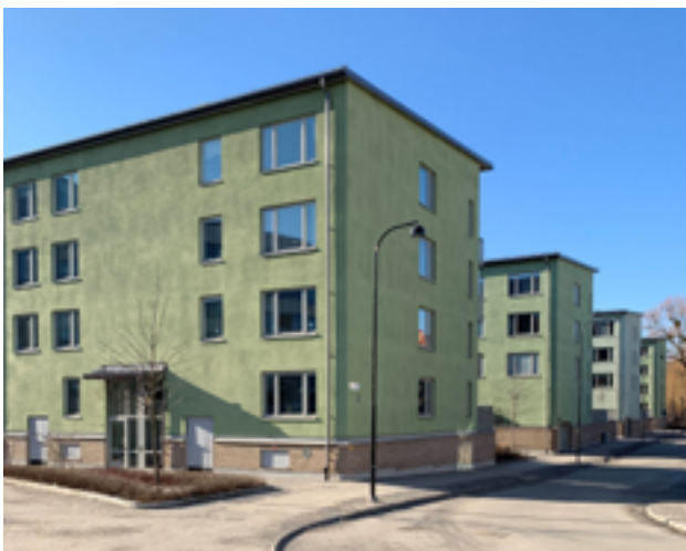
Exempel på lamellhusbebyggelse i smalhusform från Ritorp.

Stadsbyggnadskaraktären i del två omfattar förutom Råsunda också Ritorp.