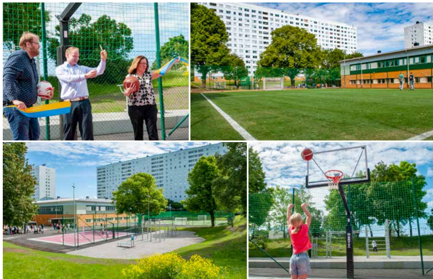
Invigning av spontanidrottsytan i Hagalund.