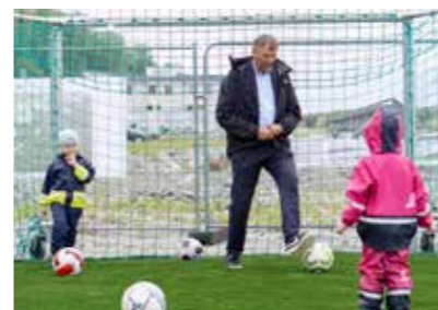
Spadtag för Järvastadens idrottsplats.