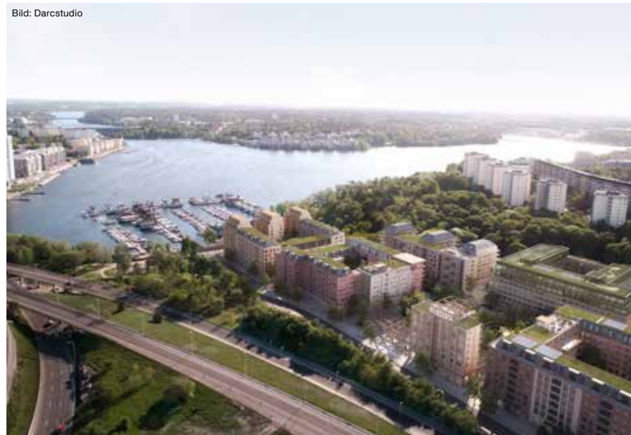
Flygvy över utvecklingen av Ekelundsområdet.