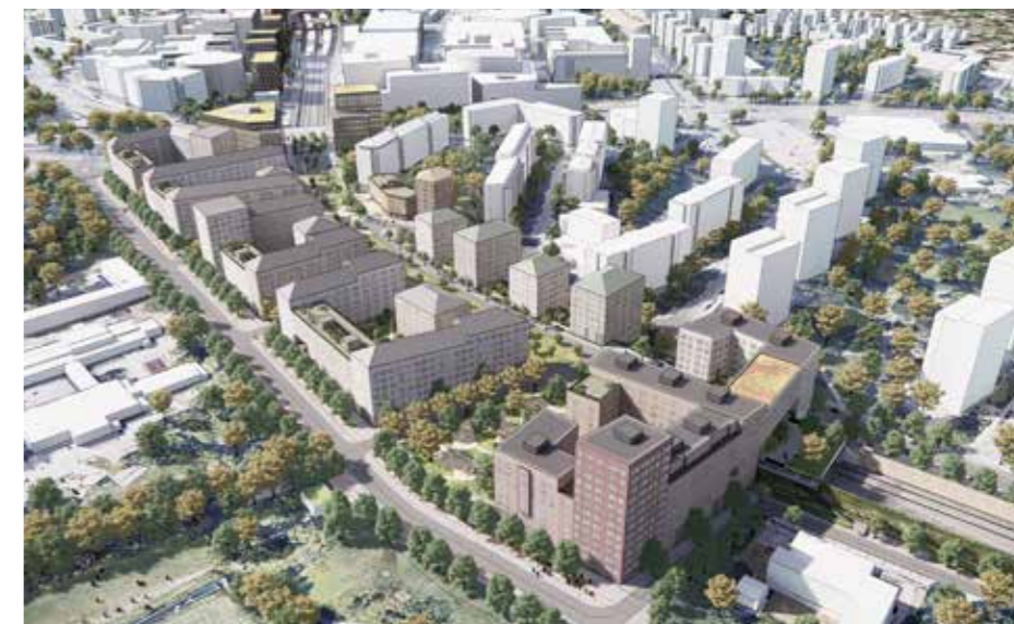
Stadsbebyggelse ovanpå intunnelingen av Mäljarbanan.